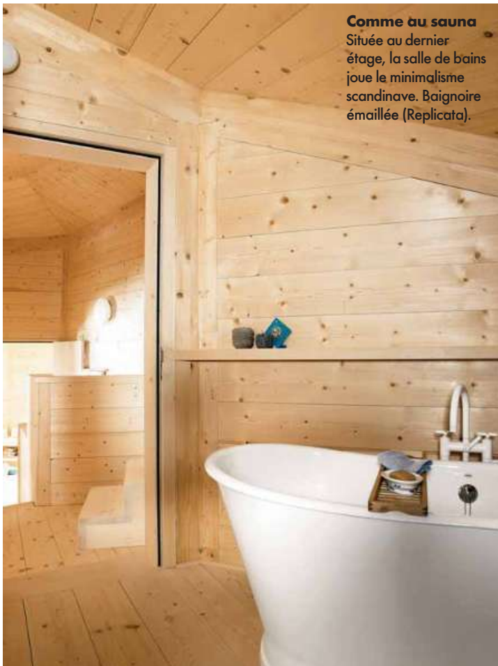
Comme au sauna Située au dernier étage, la salle de bains joue le minimalisme scandinave. Baignoire émaillée (Replicata).