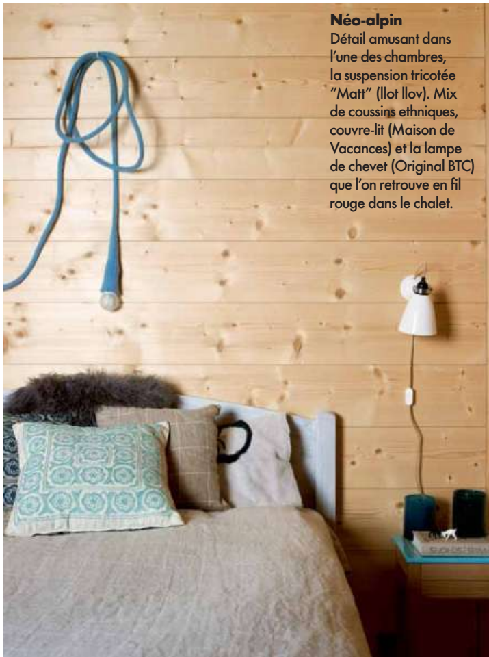
Néo-alpin Détail amusant dans l'une des chambres, la suspension tricotée "Matt" (Ilof Ilov). Mix de coussins ethniques, couvre-lit (Maison de Vacances) et la lampe de chevet (Original BTC) que l'on retrouve en fil rouge dans le chalet.