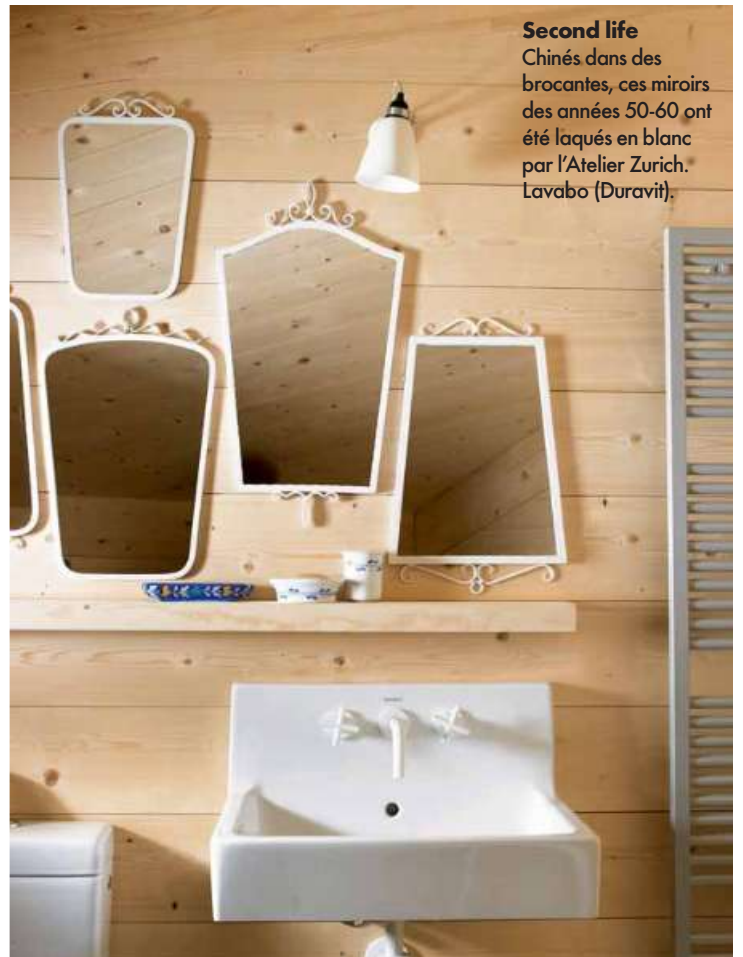
Second life Chinés dans des brocantes, ces miroirs des années 50-60 ont été laqués en blanc par l'Atelier Zurich. Lavabo (Duravit).