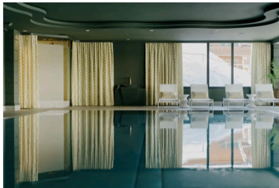
Der Wellness-Bereich mit Innenpool.

Wer nach einem anstrengenden Skitag ins Hotel zurückkehrt, kann sich im grosszügigen Spa entspannen. Highlight ist der warme Outdoor-Whirlpool – Blick auf das Matterhorn auch hier wieder inklusive.