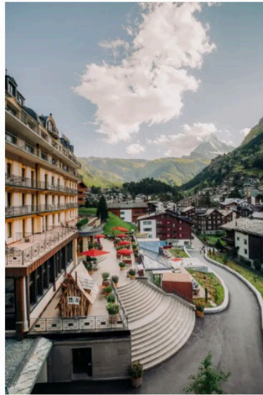
Das Hotel Beausite wurde 1907 erbaut und kürzlich in zwei Etappen umfassend renoviert.

Das 1907 erbaute Beausite wurde in zwei Etappen umfassend und aufwendig umgebaut. Im Innern des Gebäudes aus der Belle-Epoque ist der britische Einfluss unverkennbar. Verantwortlich für das gesamte Designkonzept war die Innenarchitektin Claudia Silberschmidt von Atelier Zürich.