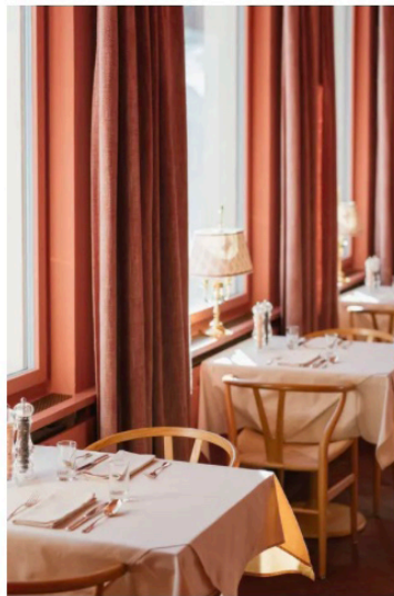
Im Restaurant «3 Seasons» wird Schweizer Küche serviert.

Da passt ein edler Bordeaux perfekt als Begleitung. Die Auswahl auf der Weinkarte ist breit. Eine gute Wahl ist der jetzt trinkreife, elegante Château Phélan-Ségur 2012 aus dem St.-Estèphe oder Château Cambon-la Pelouse 2010 aus dem Haut-Médoc. Aber auch zahlreiche Walliser Tropfen sind im Angebot zu finden. In der Wine-Box finden regelmässig Weindegustationen mit eingeladenen Winzern und Winzerinnen statt.