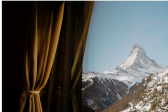
In den meisten Zimmern genießt man freie Sicht aufs Matterhorn.