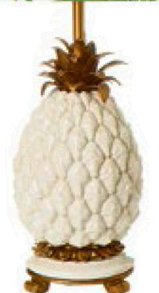
Ananas-Gefäss aus Keramik, ab Fr. 19.90, von Interio.